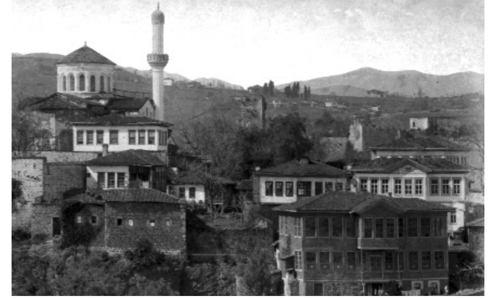
Yeni Cula Camii (St. Eugenios Kilisesi)

Ancak 1553 sonrası kayıtlara bakıldığında, şehrin Müslüman nüfusunda dramatik bir artış göze çarpar. Lowry, bu verilerden hareketle şu sonuçlara varıyor: