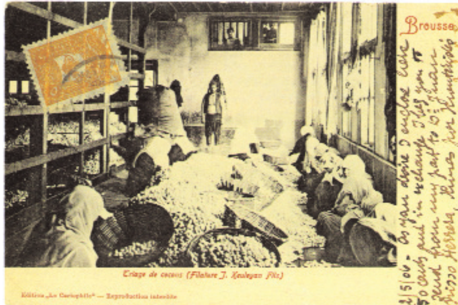
"Bursa J. Kölyan Mahdumları İflatür fabrikasında koza seçme işlemi." (2 Mayıs 1906'da gönderilmiş bir kartpostal)

Kitabın dördüncü bölümünde, İttihat Terakki'nin II. Meşrutiyet döneminde ekonomiyi düzenleme çabaları ve bunun bir yansıması olan 'Milli İktisat' projesi ele alınıyor. İttihat Terakki yönetimi, II. Meşrutiyet'in siyasi alana getirdiği 'serbesti' anlayışıyla da ilintili olarak, iktisadi alanda liberal bir ekonomik anlayışı benimsemişti ve bir yandan toplumsal refahın artırılması amacıyla bireysel girişimciliği desteklerken diğer yandan ekonomi politikasını 'Milli İktisat' projesi üstüne temellendirerek, yaratacağı Müslüman-Türk bir burjuvazi sayesinde gayri-